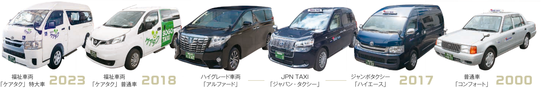
福祉車両「ケアタク」特大大車 2023 福祉車両「ケアタク」普通車 2018 ハイグレード車両「アルファード」 JPN TAXI「ジャパン・タクシー」 ジャンボタクシー「ハイエース」 2017 普通車「コンフォート」 2000