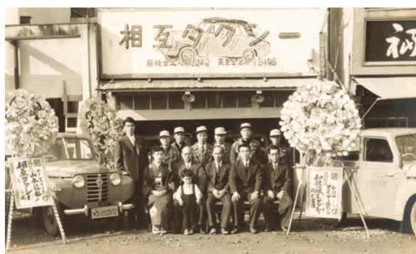
1954 創業当初、築地営業所前での記念撮影 当時としては、しゃれた電光ネオンサインの看板