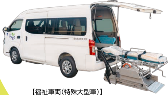
【福祉車両(特殊大型車)】 日産キャラバンNV350