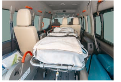
寝たままの状態でも搬送できる「ストレッチャー」